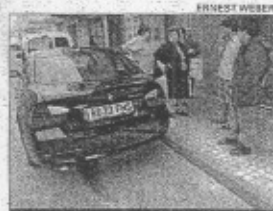
Coché sobre el que cayó la niña

Una niña de tres años de edad sufrió ayer heridas muy graves tras precipitarse al vacío desde su domicilio, ubicado en un tercer piso, y caer sobre un coche.